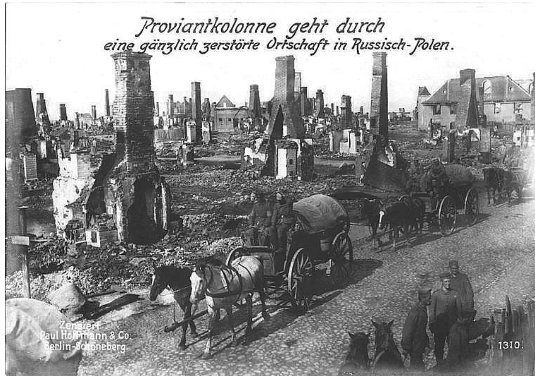
Wojska niemieckie w zniszczonej miejscowości polskiej

W Niemczech koła przemysłowe, militarne i nacjonalistyczne związane z Ligą Pangermańską planowały kolonizację Wschodniej Europy. Projekt ten miał przyjąć nazwę „Mitteleuropä”, bloku ekonomicznego pod przywództwem Cesarstwa Niemieckiego, które wykorzystując zasoby ekonomiczne tego rejonu zamierzały uzyskać potęgę zdolną do zwycięskiej rywalizacji z innymi mocarstwami światowymi. Polska w tym projekcie miała grać rolę małego państwa zmniejszającego możliwość konfliktów między większymi mocarstwami, poddanego stopniowej germanizacji. Z terytorium dawnego Królestwa Kongresowego zamierzano zająć „Polski Pas Przygraniczny”, z którego Niemcy planowali wypędzić Polaków i Żydów, a na ich miejsce osiedlić kolonistów niemieckich. Marionetkowe państwo Polskie miało być monarchią, na której tronie osadzony zostałby arystokrata z Niemiec lub Austrii.