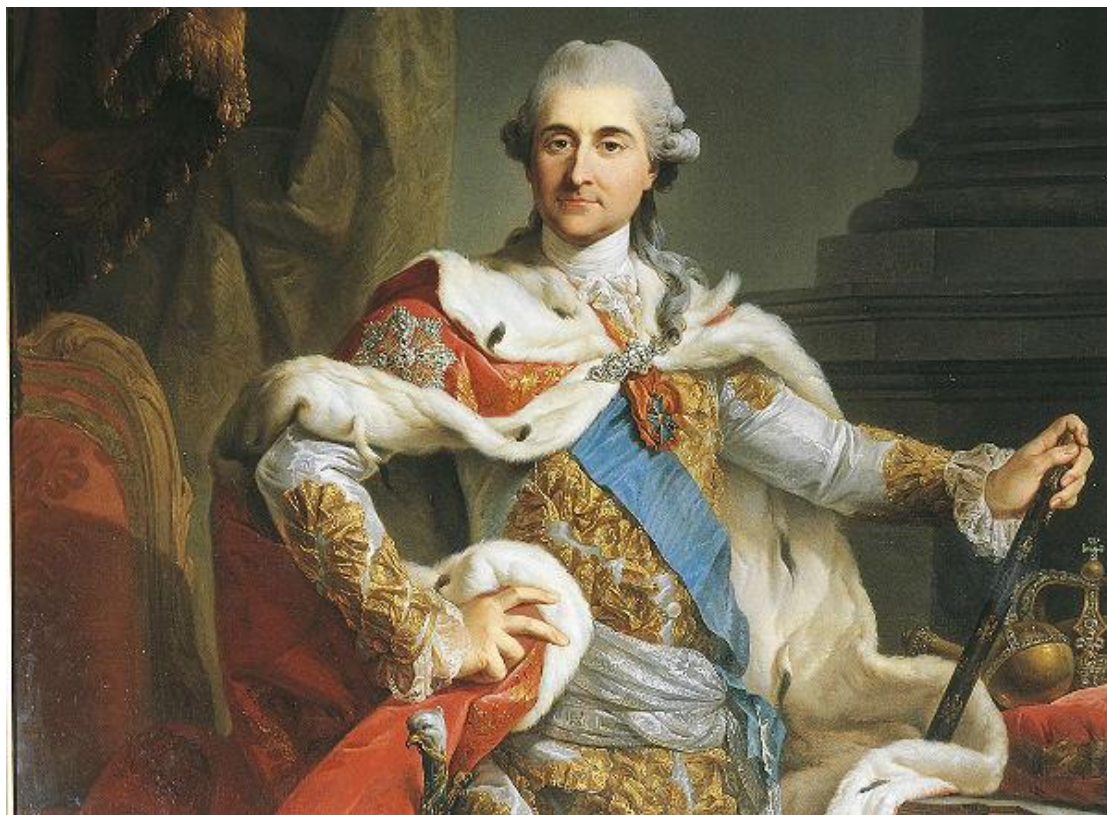
Król Stanisław August Poniatowski