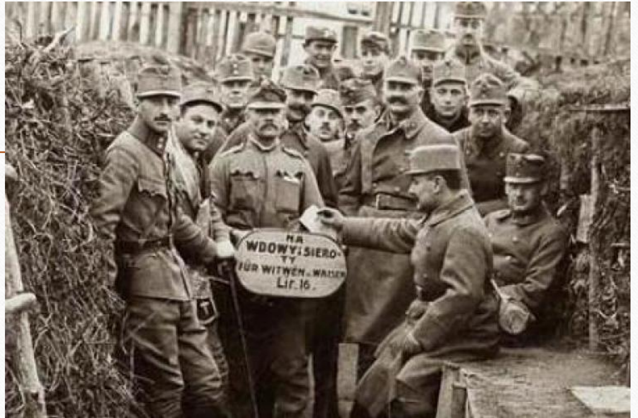
Polacy w armii austriackiej - 16 Pułk Piechoty Obrony Krajowej "Kraków". Wrzesień 1918 r.

W czasie trwania konfliktu Polacy walczyli w armiach wszystkich zaborców, ponosząc ogromne straty. Szacuje się, że łącznie w armii niemieckiej, rosyjskiej i austro-węgierskiej walczyło ok. 3 milionów Polaków, a zginęło około 500 tys. z nich