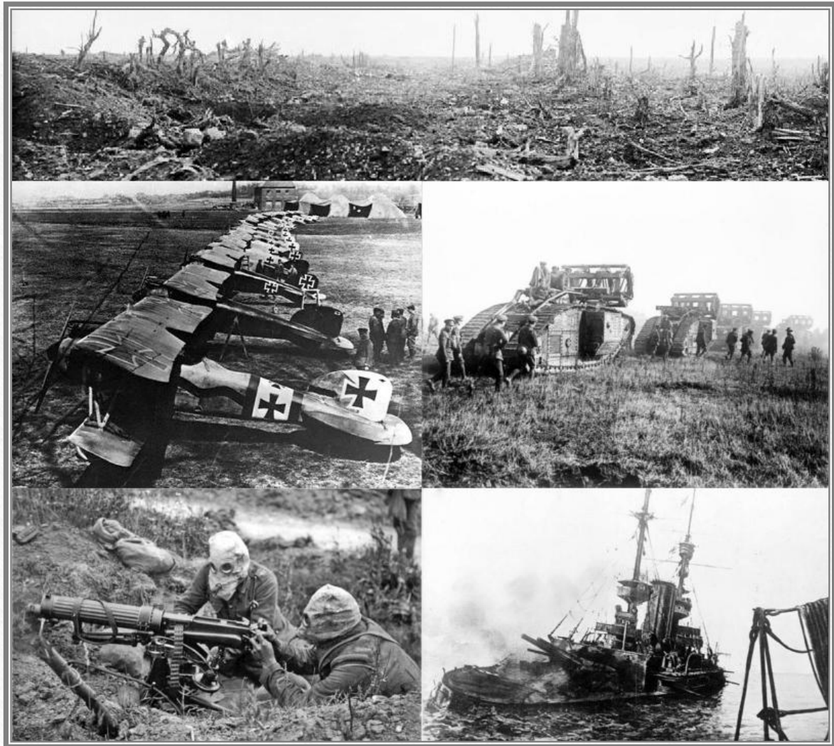
Maszyny wykorzystywane podczas I Wojny Światowej

Był to największy konflikt zbrojny w Europie od czasu wojen napoleońskich.