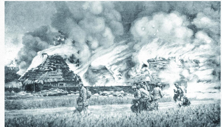
Płonąca wieś polska w czasie I wojny światowej.