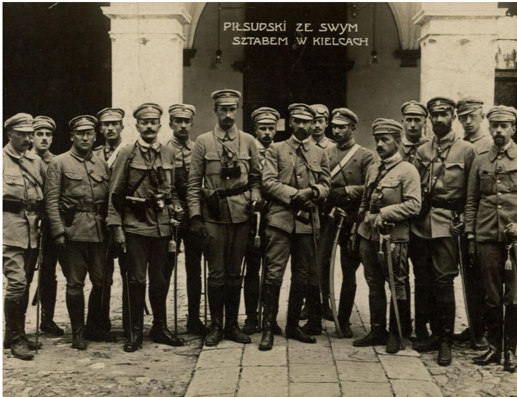
Józef Piłsudski ze swoim sztabem w Kielcach, sierpień 1914.